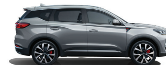
Күміс түстес сұр